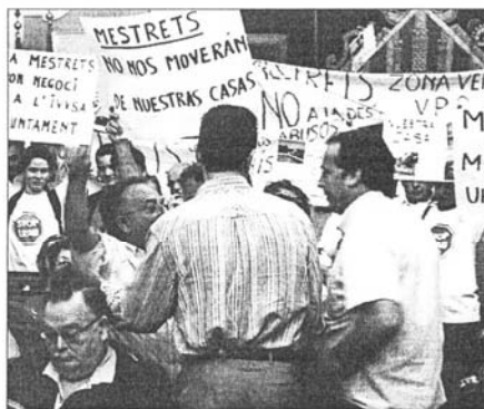
PROTESTA. Los vecinos de Els Mestrets protestando en el pleno.

La primera de las protestas vecinales mencionadas protagoni-